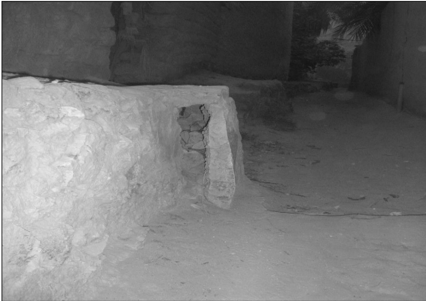
Fig 4 : photo de « kuwa » (11) :

L'eau pénètre dans chaque jardin par une ouverture appelée « kuwa » « qana », appelés localement « msaraf » ou « tisambat », délimitée par des pierres arrête vives, et dont les dimensions sont parfaitement déterminés. L'eau est dirigée vers cette ouverture par un petit endiguement qui barre obligatoirement le chemin.